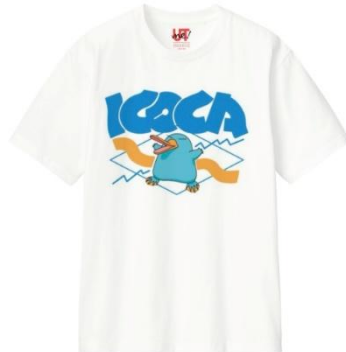
UTme! T シャツ