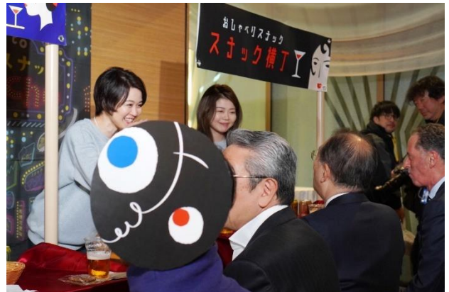
スナック横丁による「スナック体験」