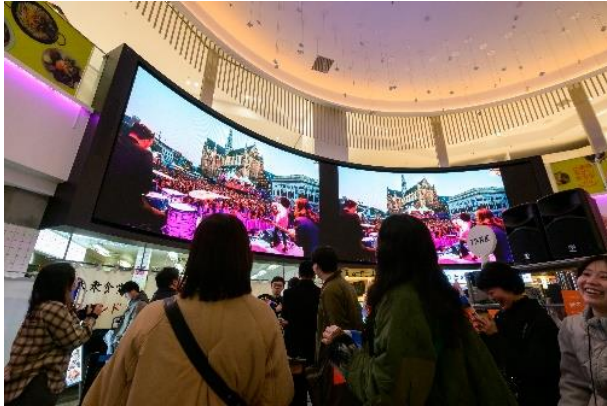
心斎橋PARCOの巨大ビジョンには オランダ本国の様子も投影