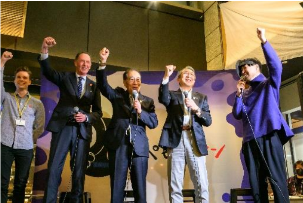
夜のパビリオン関係者によるトークセッションを実施

さらに、万博関係者による「万博と大阪の街」をテーマにしたトークセッションや、街のナイトエコノミー&カルチャーの魅力を最大化するプログラム「夜のパビリオン」の体験デモも実施しました。