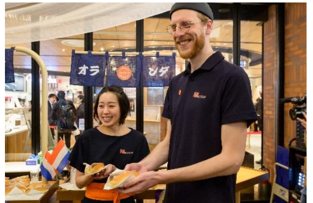
パビリオンスタッフのユニフォームや、 パビリオン内で提供されるフードメニューを初披露