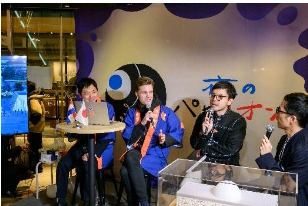
オランダパビリオンの内部を初披露する 「オランダパビリオンレビューパーティー」を実施