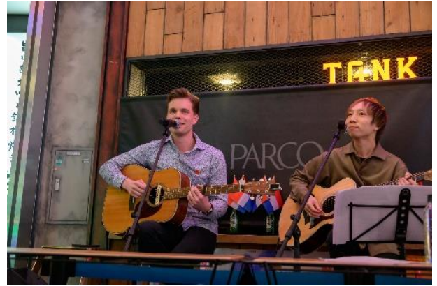
マルティン・フォーレさん(オランダ総領事館)による アコースティックライブ