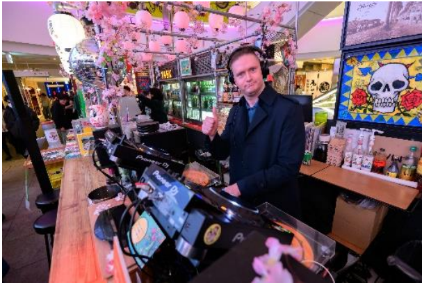
オランダ出身DJによるDJタイム