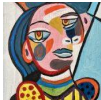
「ピカソのスタイルで自画像」 ※作画イメージ