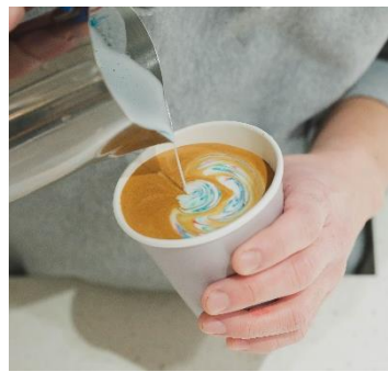
「レインボーラテアート」※イメージ

そのほか、「オルビス」による“肌診断×美肌づくりイベント”や、「ラッシュ」による“バスボム製造体験”、「フェールラーベン バイトリニティ」による“オーガニックに触れよう！～種からコットンを育てる～”WORKSHOPなど様々な体験をご用意しております。イベントの詳細・予約方法などは特設サイトをご確認ください。