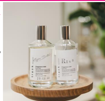
「フレグランスミスト」※イメージ