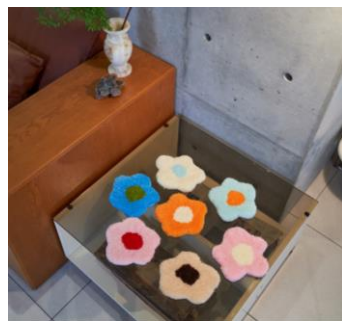
「オリジナルミニラグ」※イメージ