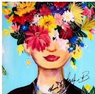
「フリーダ・カーロのフラワーポートレート」 ※作画イメージ