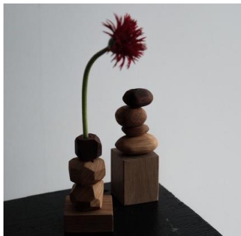
「積み木の一輪挿し」※イメージ