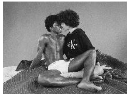
アパレルからフレグランスまで幅広いアイテムを展開し、多くの層から支持され続けるブランド「カルバン・クライン」