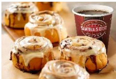
シアトル生まれのシナモンロールを展開する「シナボン」と「シアトルズベストコーヒー」がコラボした「シナボン・シアトルズベストコーヒー」