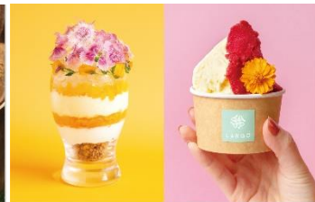
限定のジェラートが楽しめる PARFAIT&GELATO LARGO