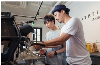
バリスタスクールも開講する PATHFINDER XNOBU