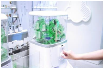
香水ガチャを展開する NOSE SHOP

その日のあなたのペースに寄り添えるような9つのお店を取り揃えました。 ニッチな香りが入っている「香水ガチャ」でその日の運命に任せた香水を選んでみたり、バリスタスクールに通ってみたり、地球にも自分にも優しいモノを知ってみたり、お買い物に疲れたら、一杯のお味噌汁を飲んでみたり、アートを眺めてみたり、ここでしか食べられない特別なスイーツに癒されてみたり。思い思いのペースで楽しめるコンテンツをご用意しています。