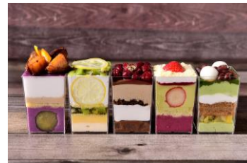
「LARGO」5種セットギフトパフェ 4,000円(送料込み・税込み)

[PACE ONLINE SHOP] https://lucuaosaka.official.ec/