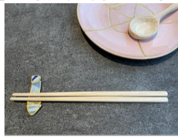
「間伐材を活用したオリジナルお箸作り」

[ワークショップ予約サイト] https://lucuaosaka.official.ec/