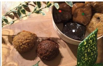
一杯のお味噌汁が味わえるお店 85(ハチゴウ)