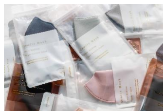
「We'll」Cool Comfit Mask 990円(税込み)