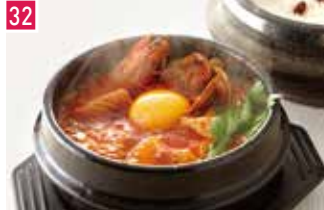
韓国料理 ビビム 146席 1 昼 ¥1,000～/夜 平均¥1,600