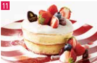
フレンチカフェレストラン カフェ ラ・ポーズ 146席 1 昼 ¥864～