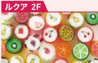
キャンディ ババブブレ