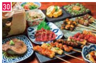
うなぎ・串焼き料理 うなぎ 串焼き いづも 📍 32席 🕒 昼 ¥950〜/夜 平均¥2,800