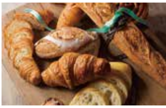
ベーカリー・カフェ メゾンカイザー 125席 1 平均¥1,080