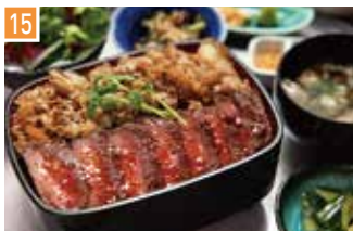
ピフテキ重・肉飯 ピフテキ重・肉飯 ロマン亭 📍 32席 🕒 昼 ¥960〜/夜 平均¥1,000