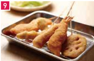
串かつ 大阪新世界元祖串かつ だるま 184席 1 昼 ¥850～/夜 平均¥2,200