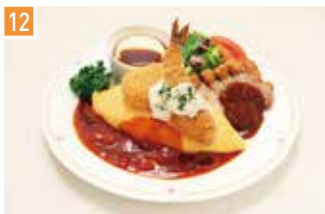
オムライス 北極星 📍 12席 🕒 昼 ¥780〜/夜 平均¥1,000