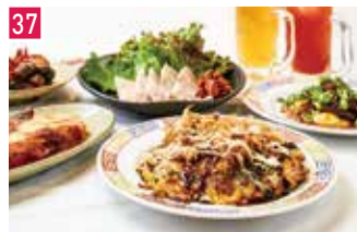
お好み焼き・鉄板焼き・韓国惣菜 お好み たまちゃん 📍 63席 🕒 昼 ¥900〜/夜 平均¥3,000