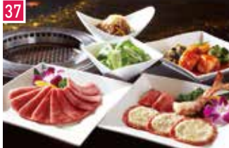
焼肉 叙々苑 169席 1 昼 ¥2,200～/夜 平均¥8,000