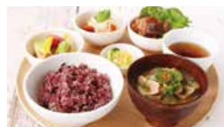
和カフェ チャノマ 📍 68席 🕒 昼・夜 平均¥1,200