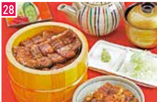
うなぎ料理 うなぎ徳 152席 1 昼 ¥2,484～/夜 平均¥5,000