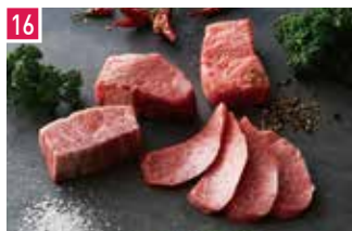
焼肉 焼肉トラジ 📍 80席 🕒 昼 ¥1,500〜/夜 平均¥5,000