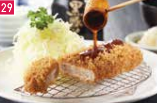
とんかつ とんかつ まい泉 166席 1 昼 ¥1,100～/夜 平均¥1,700