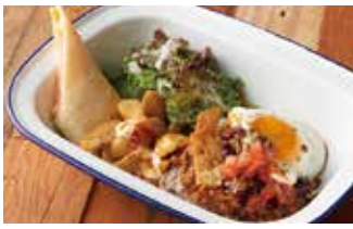
カフェ ワイアードカフェ 1120席 1 昼 ¥874～/夜 平均¥1,543