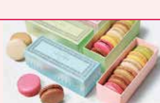
マカロン・洋菓子 ラデュレ