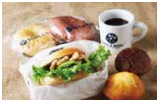
ベーグル ベーグル&ベーグル 17席 1 平均¥700