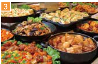
お惣菜・お弁当 クックデリ御膳 📍 3席 🕒 昼 ¥300〜/夜 平均¥700