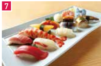
寿司 鮎処 音羽 125席 1 昼 ¥1,200～/夜 平均¥5,000