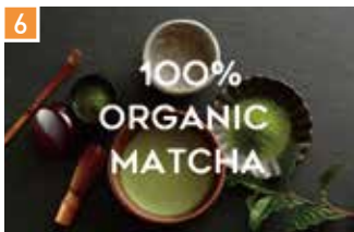
オーガニック抹茶 ザ マッチャ トウキョウ 📍 4席 🕒 昼 ¥496〜/夜 平均¥700