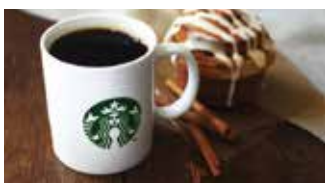
カフェ スターバックス コーヒー グランマルシェ 📍 82席 🕒 ¥500〜