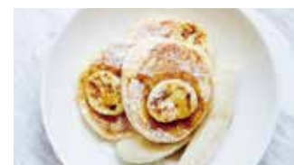
カジュアルダイニング ビルズ 📍 118席 🕒 昼 ¥1,400〜/夜 平均¥3,000