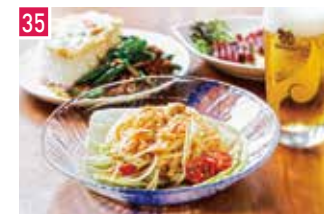
タイ料理 タイ国政府認定五ツ星レストラン クンテープ 📍 28席 🕒 昼 ¥1,200〜/夜 平均¥2,500