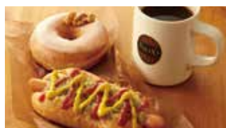
スペシャルティコーヒーショップ タリーズコーヒー 📍 56席 🕒 ¥320〜