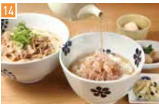
だし茶漬け・肉うどん だし茶漬け+肉うどん えん 📍 27席 🕒 昼 ¥720〜/夜 平均¥800