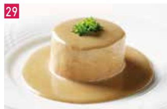
ソース料理・シャンパーニュ・ワイン ソース料理とワインが楽しめるお店 「赤白」コウハク 📍 46席 🕒 昼 ¥880〜/夜 平均¥2,800