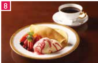
カフェレストラン 丸福珈琲店 160席 1 昼 ¥800～/夜 平均¥1,200