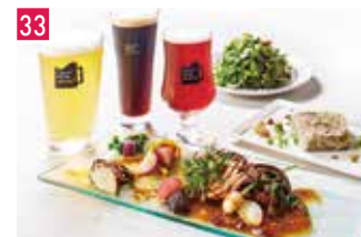
クラフトビア クラフトビアマーケット 📍 50席 🕒 昼 ¥800〜/夜 平均¥3,500