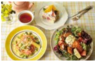
カフェ アフタヌーンティー・ラブアンドテーブル 167席 1 昼 ¥1,080～/夜 平均¥1,300