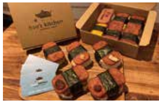
おにぎり・惣菜 ブーズ キッチン 16席 1 ¥140～