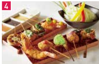
串あげもの 旬S 143席 1 昼 ¥1,180～/夜 平均¥4,300