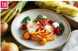
パスタ 島バスタ ミケ 152席 1 昼 ¥1,100～/夜 平均¥1,800