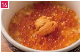
和食と醸造酒(日本酒&ワイン) 浪花ろばた 頂鍋 184席 1 昼 ¥900～/夜 平均¥4,000