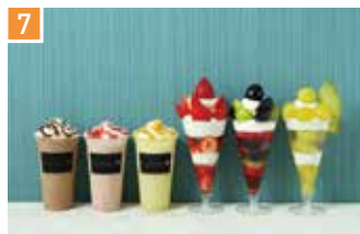
フルーツパフェ・クレープ・ドリンク マルトメ・ザ・ジュサリー パフェテリア 📍 9席 🕒 昼 ¥800〜/夜 平均¥1,200