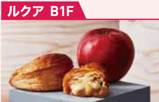
アップルパイ リンゴ