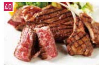
肉料理 肉びすとり 熟 Jyuku 📍 75席 🕒 昼 ¥900〜/夜 平均¥2,500