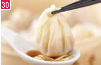
台湾点心料理 鼎泰豊 1135席 1 昼 ¥1,500～/夜 平均¥3,000