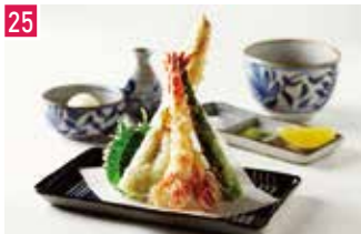
天ぷら専門店 芦屋 天がゆ 128席 1 昼 ¥1,750～/夜 平均¥3,000