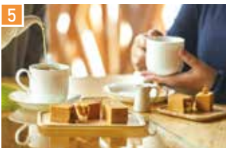
パイナップルケーキ・焼き菓子 サニーヒルズ 🕒 ¥700〜