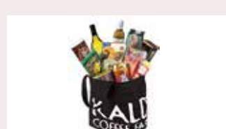
コーヒー豆・輸入食品 カルディコーヒーファーム