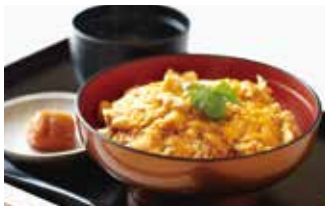
惣惣菜・親子丼 鶏三和 110席 1 平均¥800