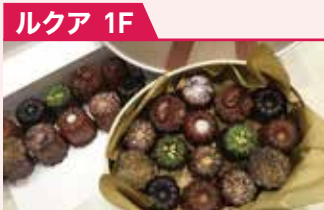
焼菓子・スイーツ ダニエル