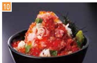
海鮮和食・お弁当惣菜 築地食源ちゃん 📍 33席 🕒 昼 ¥600〜/夜 平均¥1,200