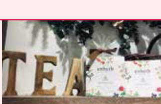
ハーブ専門店 エンハーブ