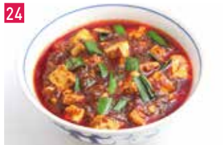
中華四川料理 中国名菜 陳麻婆豆腐 170席 1 昼 ¥1,200～/夜 平均¥2,500