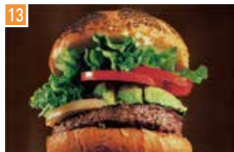
ハワイアングルメバーガー&カフェ クア・アイナ 📍 75席 🕒 昼 ¥955〜/夜 平均¥1,300