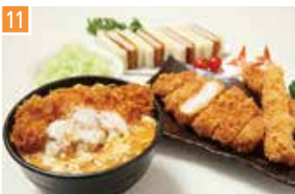
とんかつ・惣菜・お弁当 とんかつ 新宿さぼてん 📍 22席 🕒 昼 ¥500〜/夜 平均¥1,000