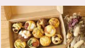
菓子 オヤツヤイス