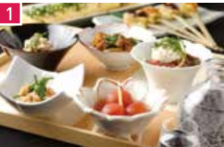
京料理 おぼんざい・炙り焼き・酒 菜な 1184席 1 昼 ¥1,080～/夜 平均¥4,300