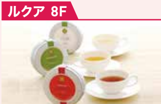
世界のお茶 ルビシア