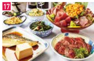
大衆飲み処 創業明治23年 徳田酒店 📍 56席 🕒 昼 ¥700〜/夜 平均¥2,300