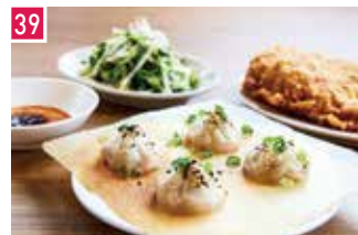
台湾屋台料理 羽根つき焼小籠包 鼎's (Din's) 📍 70席 🕒 昼 ¥950〜/夜 平均¥2,500