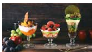
パフェ・ジェラート パフェ&ジェラート ラルゴ 📍 54席 🕒 昼 ¥980〜/夜 平均¥1,600