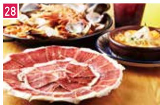
スペインバル ハモネリア ベジョータ ギョクロ 📍 24席 🕒 昼 ¥980〜/夜 平均¥2,500