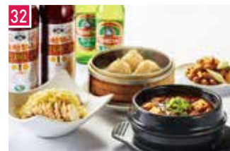
中華 幸福飯店 ハッピーハンテン 📍 52席 🕒 昼 ¥950〜/夜 平均¥2,000