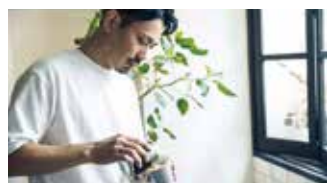
カフェ・ワークショップ パスファインダー タイムスノブ 📍 11席 🕒 ¥550〜