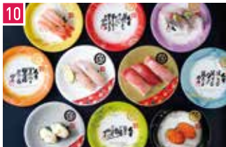
寿司 金沢まいもん寿司 152席 1 昼 ¥1,650～/夜 平均¥3,000