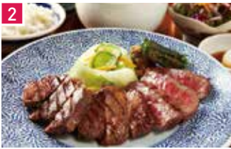
牛たん・仙台牛 炭焼牛たん東山 168席 1 昼 ¥980～/夜 平均¥2,500