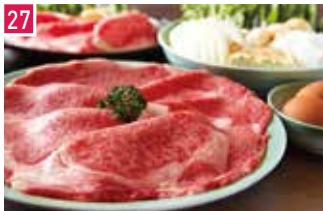
すき焼き・しゃぶしゃぶ・オイル焼き モリタ屋 154席 1 昼 ¥2,160～/夜 平均¥5,000