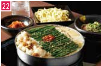
もつ鍋・ホルモン 博多もつ鍋 おおやま 1128席 1 昼 ¥980～/夜 平均¥3,000