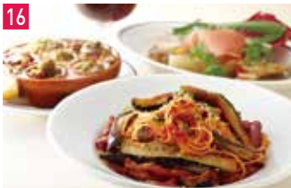
イタリアンパ ラヴァーニャ 153席 1 昼 ¥980～/夜 平均¥2,000