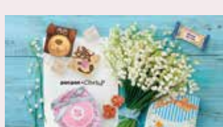
スイーツ ポンポン × クリスピー