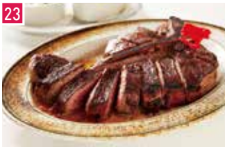
ステーキハウス ウルフギャング・ステーキハウス by ウルフギャング・ズウィナー 1112席 1 昼 ¥1,800～/夜 平均¥14,500