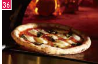
ピッツェリア・トラットリア エキ ボンテベッキオ ア オオサカ 134席 1 昼 ¥1,620～/夜 平均¥3,000