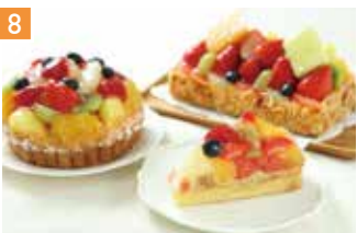
スイーツ・カフェ ミヤムミヤム 📍 8席 🕒 昼 ¥700〜/夜 平均¥950