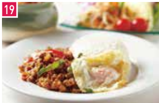
タイ料理 マンゴツリーカフェ 大阪 146席 1 昼 ¥980～/夜 平均¥1,800