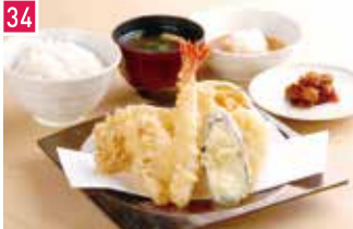
天ぷら専門店 博多天ぷら たかお 134席 1 昼 ¥890～/夜 平均¥1,100