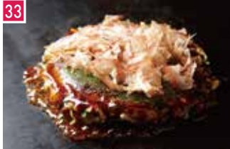
お好み焼 大阪生野 桃太郎 153席 1 昼 ¥820～/夜 平均¥1,800