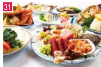
海鮮が安いだけの店 魚屋スタンドふじ子 📍 76席 🕒 昼 ¥995〜/夜 平均¥2,800