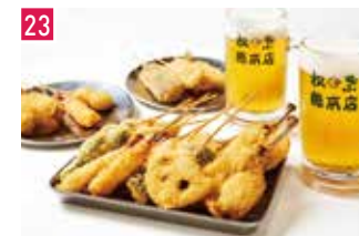
串かつ 松葉 📍 立ち飲み専門店 🕒 昼 ¥1,500〜/夜 平均¥1,500