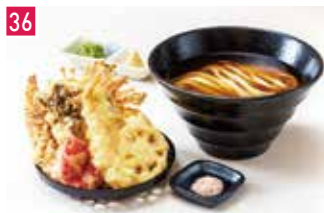
うどん・天ぷら 本町製麺所 天 📍 30席 🕒 昼 ¥860〜/夜 平均¥1,300