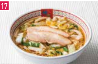
ラーメン どうとんぼり神座 140席 1 昼 ¥750～/夜 平均¥800