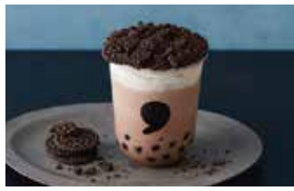
ティースタンド コンマトゥーゴー 17座席なし 1 ¥520～