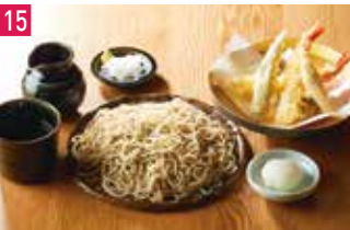
石臼挽き二八そば 石臼挽き二八そば そばしき 150席 1 昼 ¥800～/夜 平均¥3,000