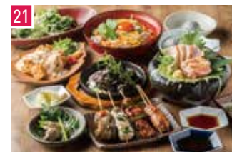
炭火焼鳥・鶏料理 炭火焼鳥 権兵衛 📍 50席 🕒 昼 ¥800〜/夜 平均¥2,800