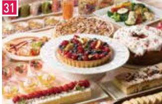
ビュッフェレストラン ザ ブラチナム 1124席 1 昼 ¥1,834～/夜 平均¥2,590