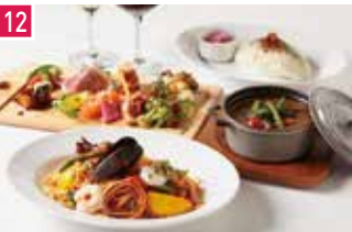
ビストロバー スパッカ アルバータ 126席 1 昼 ¥980～/夜 平均¥1,700