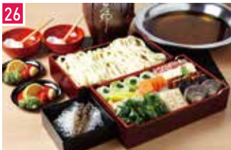
うどんすき・日本料理 美々卯 164席 1 昼 ¥810～/夜 平均¥2,400