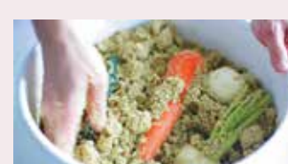
生活雑貨・食品 85 [ハチゴウ]