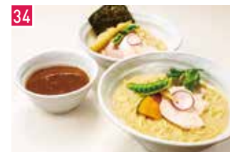
ラーメン 銀座 篝 📍 20席 🕒 昼 ¥900〜/夜 平均¥900