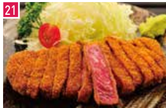
牛かつ 牛かつ もと村 142席 1 昼 ¥1,400～/夜 平均¥1,600