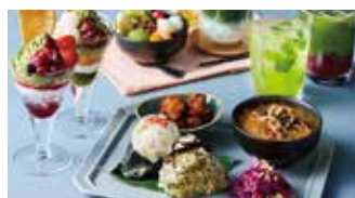
和カフェ 伊右衛門カフェ 📍 62席 🕒 昼 ¥1,000〜/夜 平均¥1,000