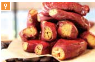
焼き芋・コーヒー 焼き芋専門店 維新蔵 📍 2席 🕒 昼 ¥550〜/夜 平均¥800