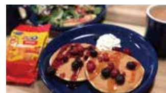
カフェ・プレイグラウンド スタジオカフェ ズーアドベンチャー 📍 40席 🕒 昼 ¥500〜/夜 平均¥800