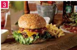
ニューヨーク カジュアルダイニング レストラン&カフェ グッド・プロヴィジョン 1110席 1 昼 ¥930～/夜 平均¥2,500