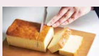
チーズケーキ ハイチーズ