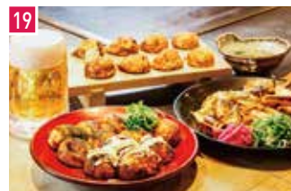
たこ焼き あべの たこやき やまちゃん 📍 40席 🕒 昼 ¥500〜/夜 平均¥800