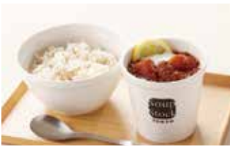
スープ スーパーストックトーキョー 151席 1 朝セット ¥500 / 昼・夜 ¥780～