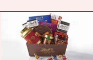
チョコレート・カフェ リンツ ショコラ カフェ