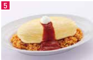
卵料理・カフェ サロン 卵と私 146席 1 昼 ¥1,000～/夜 平均¥2,000