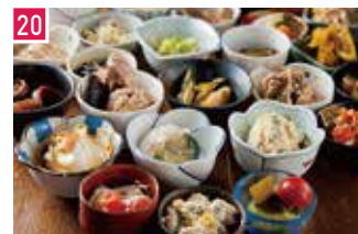
立ち飲み居酒屋 となりのジャックとマチルダ 📍 30席 🕒 昼 ¥2,000〜/夜 平均¥2,000