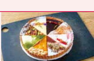
洋菓子・タルト マルサンカクシカク 9/3(金) 移転オープン