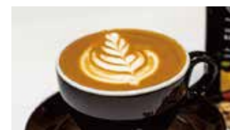
珈琲豆・カフェ サンワコーヒーワークス 📍 35席 🕒 ¥350〜