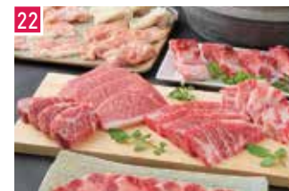
焼肉・ホルモン やきにく 萬野 📍 38席 🕒 昼 ¥1,000〜/夜 平均¥3,500