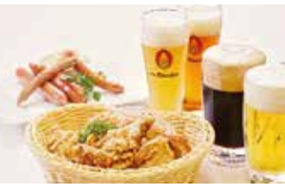
ビアレストラン キューヒェ ニューミュンヘン 1150席 1 昼 ¥1,300～/夜 平均¥2,500