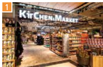
食品・ワールドダイニング キッチン&マーケット 📍 300席 🕒 昼 ¥750〜/夜 平均¥2,000