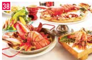
イタリアンバル 海老talianバル 📍 56席 🕒 昼 ¥850〜/夜 平均¥2,500