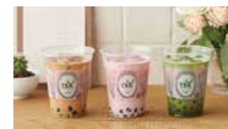
ティールーム アルフレッド ティー ルーム 📍 118席 🕒 ¥410〜