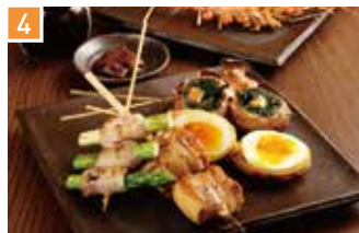
串焼き 串焼き 満天 📍 40席 🕒 昼 ¥900〜/夜 平均¥2,500