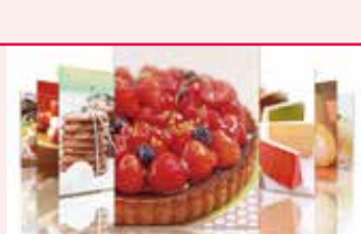
期間限定スイーツ スイーツボックス