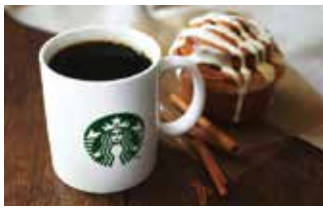
カフェ スターバックス コーヒー 146席 1 ¥500～