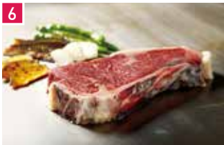
熟成肉専門 但馬屋 135席 1 昼 ¥2,052～/夜 平均¥5,000