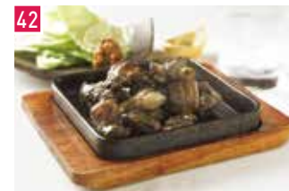
宮崎料理 宮崎酒場 ゑびす 📍 63席 🕒 昼 ¥980〜/夜 平均¥3,500