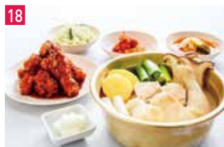
韓国料理 韓国酒場 コッキオ 📍 48席 🕒 昼 ¥980〜/夜 平均¥2,000