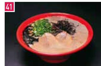
豚骨ラーメン 博多新風 ラーメン食堂 📍 35席 🕒 昼 ¥750〜/夜 平均¥950