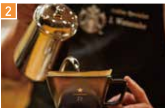
スペシャルティ コーヒーストア スターバックス コーヒー 📍 90席 🕒 ¥650〜