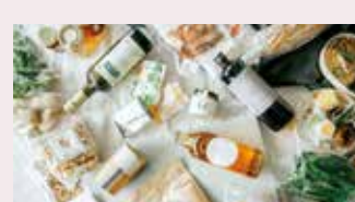
オーガニック食品 グローサ オーガニック