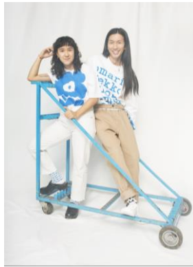
マリメッコの新ライン! 全国初直営店! 「マリメッコ キオスキ」