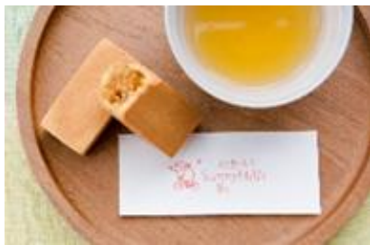
台湾生まれのスイーツブランド 「サニーヒルズ」

西日本初出店の「パインアップルケーキ」でお馴染みの台湾生まれのスイーツブランド「サニーヒルズ」や、全国初出店のマリメッコの新ライン!「マリメッコ キオスキ」、話題のD2Cブランド「アニュアンス」など、“ファッション”も“お家でも”楽しめる幅広いジャンルの注目のNewショップが続々オープンいたします。