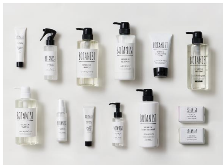
ヘアケアアイテムを中心とする人気ブランド「ボタニスト」

ヘアケアアイテムで人気のブランド「ボタニスト」や、オーガニック抹茶専門店の「ザ マッチャ トウキョウ」が西日本初出店するほか、台湾のティーショップ「チャノン」や、新しいエステの形を提案する、定額制のセルフエステジム「じぶんdeエステ」など、ファッションはもちろん、カフェやスイーツ、コスメまで注目のNewショップが続々オープンいたします。