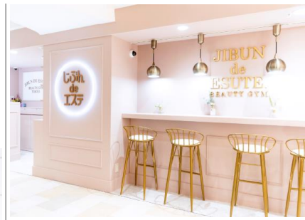
定額制の通り放題セルフエステジム「じぶんdeエステ」