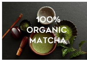
オーガニック抹茶専門店「ザ マッチャ トウキョウ」 台湾の人気ティーショップ「チャノン」