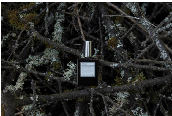
「オウパラディ」のギフトをメインにしたショップ 「カドー オウパラディ」