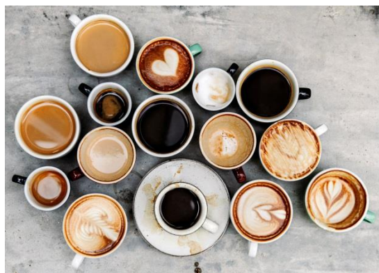
コーヒーとワッフルをメインにした全国初の 新業態「ロッカアンドフレンズ コーヒー フロー」

人気カフェ店「ロッカ&フレンズ」の“コーヒーとワッフル”に特化した新業態「ロッカアンドフレンズ コーヒー フロー」や、日本の空気に合うようにと作られた香りを展開する「オウパラディ」のギフトをメインにした「カドー オウパラディ」が全国初登場するほか、女性をより美しく魅せるジーンズブランド「サムシング」や、機能性とデザイン性を兼ね備えた補整下着ブランド「ブラデリスニューヨーク」など、春にぴったりな新しいお店が続々オープンいたします。