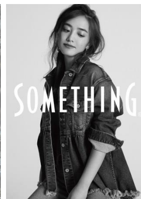
女性をより美しく魅せる、 女性の為のジーンズブランド 「サムシング」